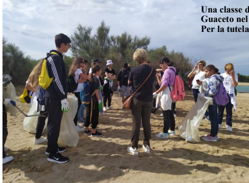
Una classe dell'Istituto impegnata a Torre Guaceto nel progetto Cascade Per la tutela del mare

E' un progetto che si occupa della tutela dell'ambiente, in particolare in ambito marino. Con la classe ci siamo recati alla riserva naturale di Torre Guaceto e abbiamo raccolto i rifiuti abbandonati sul Litorale.